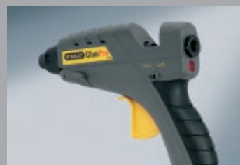
PIŠTOLE NA TAVNÉ LEPIDLO